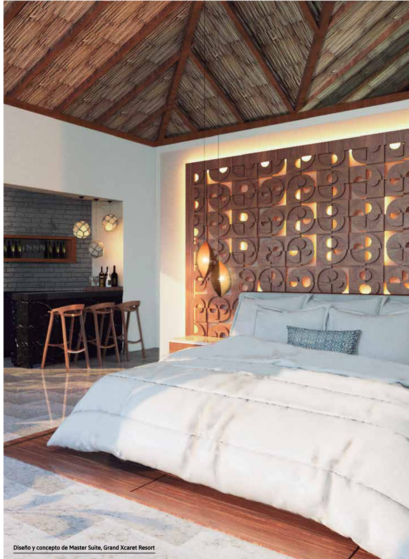
Diseño y concepto de Master Suite, Grand Xcaret Resort