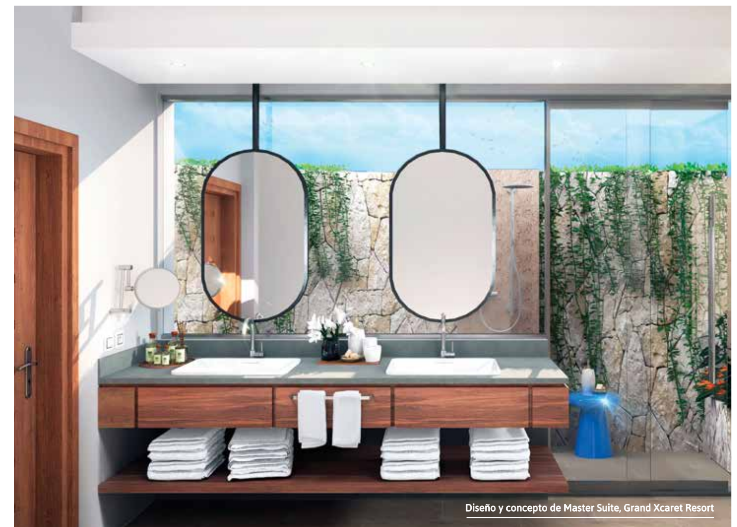
Diseño y concepto de Master Suite, Grand Xcaret Resort