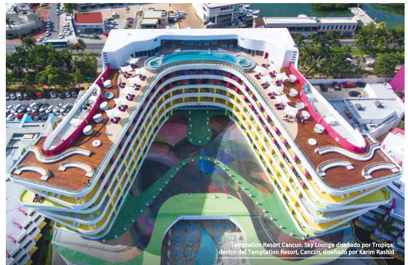
Temptation Resort Cancun, Sky Lounge diseñado por Tropiqa, dentro del Temptation Resort, Cancún, diseñado por Karim Rashid

"Debes sensibilizarte y ser empático con las necesidades de los clientes."